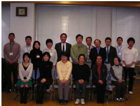
運営委員とセンタースタッフ

市民おもしろ大学、市民活動センターまつり、商工会議所との協働事業などを検討し実行する